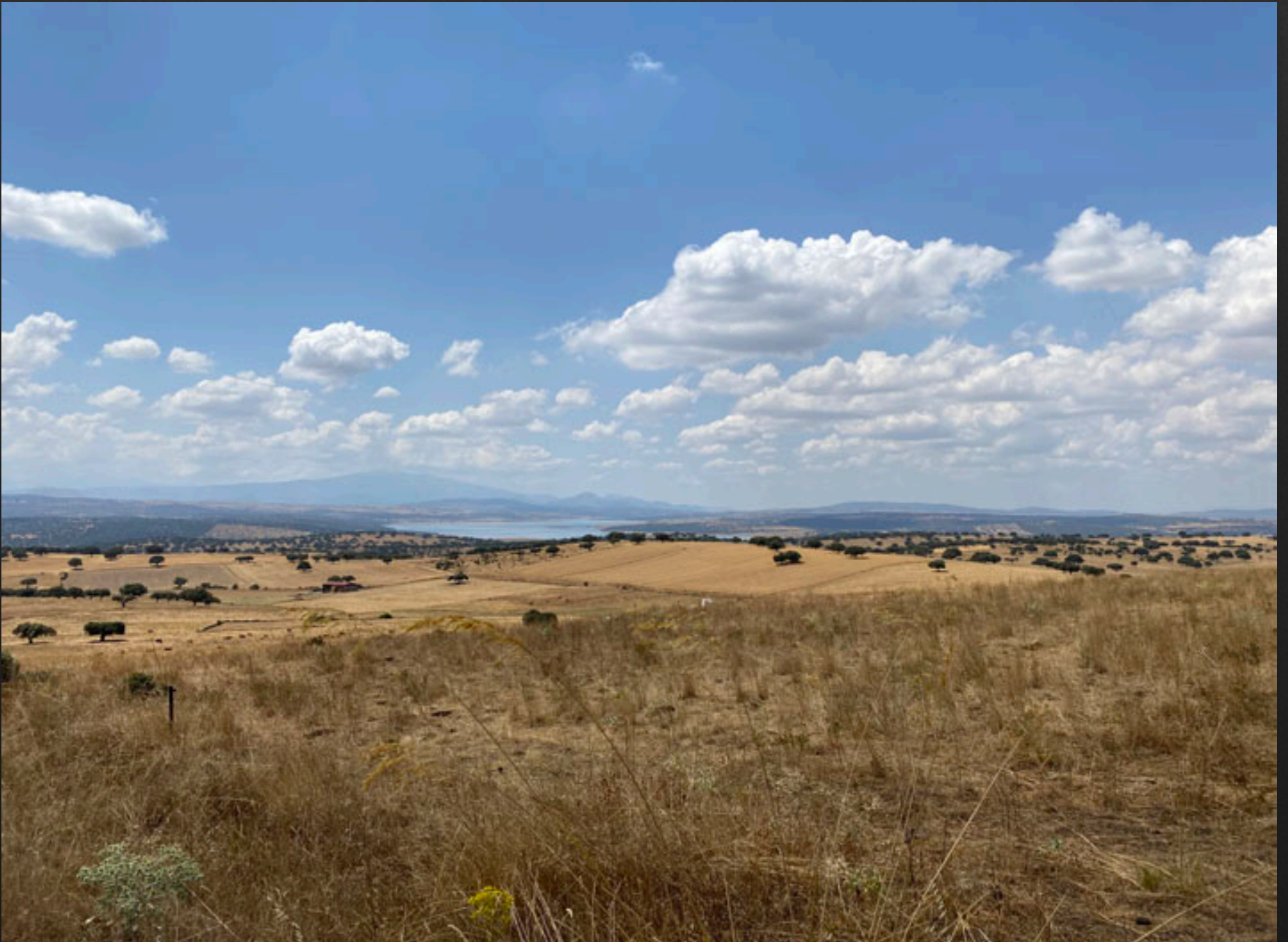
Vistas al Sur. Destaca el Pantano de Santa Teresa.

Las vistas del sur sin duda sorprenden por el contraste. Teniendo a los pies el pantano y viendo su enorme masa de agua, al levantar la mirada nos encontramos con las altas cumbres de Gredos, se aprecia sobre manera el macizo occidental, la Sierra de Béjar y la Peña negra de Becedas, y podemos ver a lo lejos el macizo central a nuestra izquierda, la Sierra Llana de Bohoyo y las estribaciones del Almanzor.