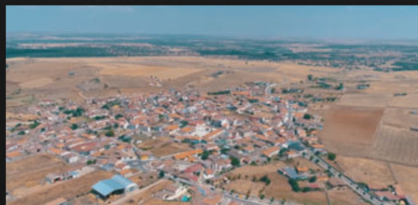
Galinduste a vista de dron.

a lo largo de los siglos, refugio de fauna y flora y con alto valor agropecuario.