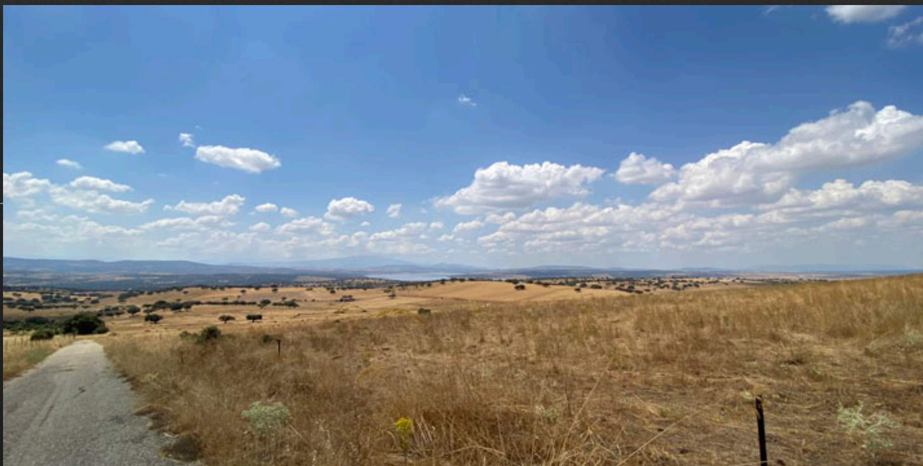
Camino asfaltado que lleva hacia el Mirador.

El segundo acceso es por la carretera de Alba de Tormes-Piedrahíta CL 510, saliendo de Alba de Tormes se toma el primer desvío a la derecha, pasando por Éjeme, Galisancho y Santa Inés, esta última localidad se deja a la izquierda, llegaremos a Galinduste y sin abandonar la travesía y una vez realizada la rotonda dirección Pelayos encontramos una salida a la izquierda, subiendo altura y con un doble giro llegaremos al mirador de la Atalaya, que iremos visualizando todo el tiempo.