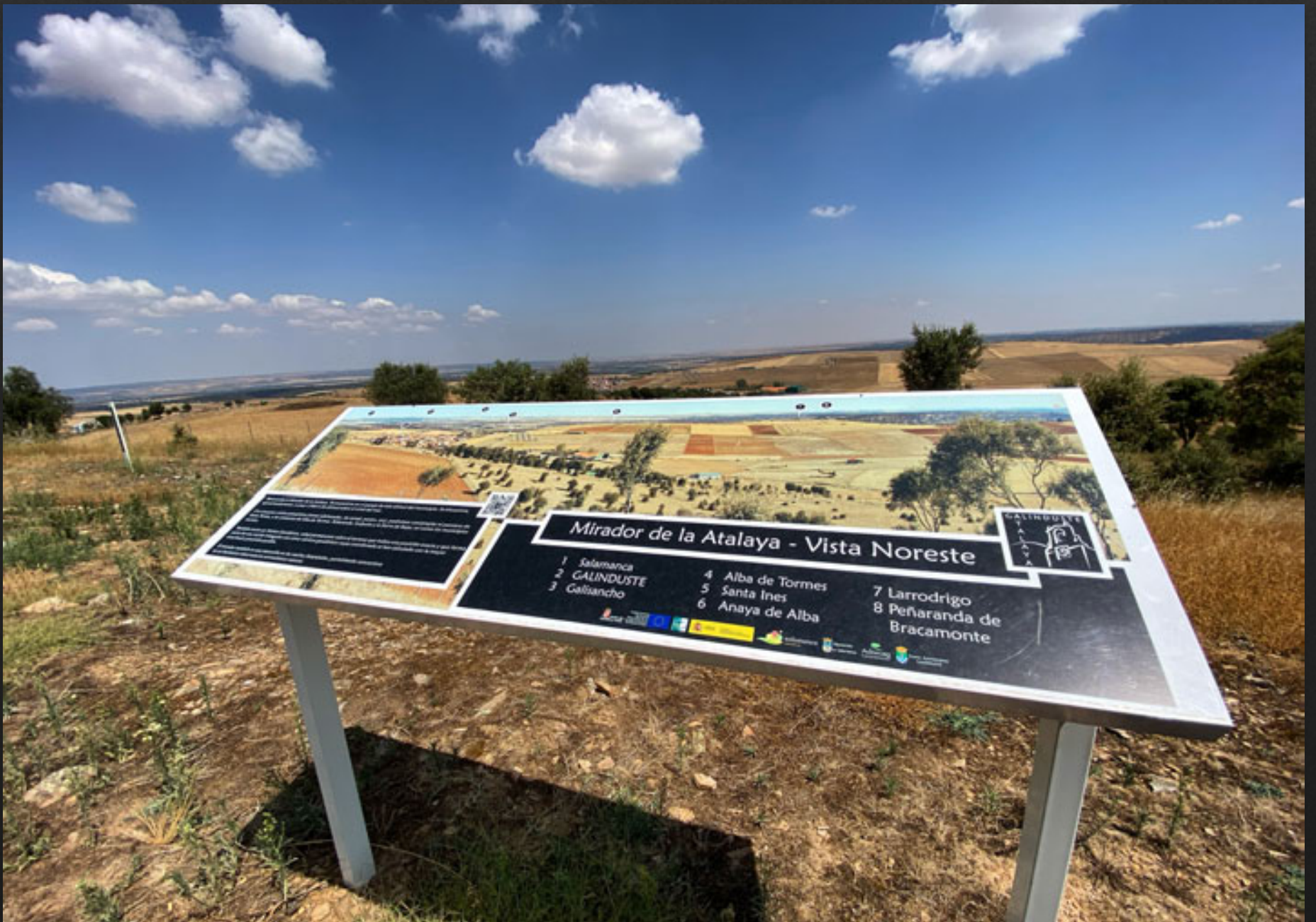
Vista Noreste del Mirador de la Atalaya.

Desde La Atalaya se puede disfrutar de un paisaje agrario tanto de secano (noreste) como de regadío en la ribera del Tormes (norte) donde las principales producciones de regadío se centran en la patata y el maíz, siendo cada vez más frecuente el cultivo hortícola.